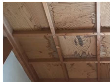
雨漏りのためにできた天井板のシミ。

鈴鹿市算所町で自治会長を務めており、町の神社やお寺を建物共済に加入させていただいています。寺社は万一、大型台風や大地震など、思いがけない災害があった場合、一般的な住宅と比べて高額な費用が必要になります。近年の資材費の高騰によって修繕費用はさらに高くなり、町の予算だけで修繕するにはとても難しい状況です。町の大事な寺社・仏閣を守っていくためにも、建物共済はなくてはならないと感じています。昨年も、台風によってお寺の屋根瓦がずれてしまい雨漏りが起きてしまいましたが、共済金で補償していただきました。手続きから支払いまで丁寧・迅速に対応していただき非常に助かりました。