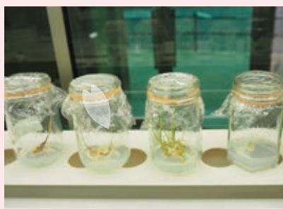
根端採取から4ヶ月ほどで土に植えることができる。