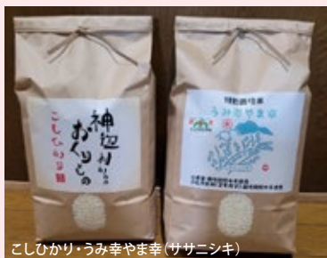
こしひかり・うみ幸やま幸(ササニシキ)

先祖代々受け継いだ土地を守りながら、13haの水田を管理している。自然に優しい農法を取り入れ美味しく安全なお米作りに励んでいる。