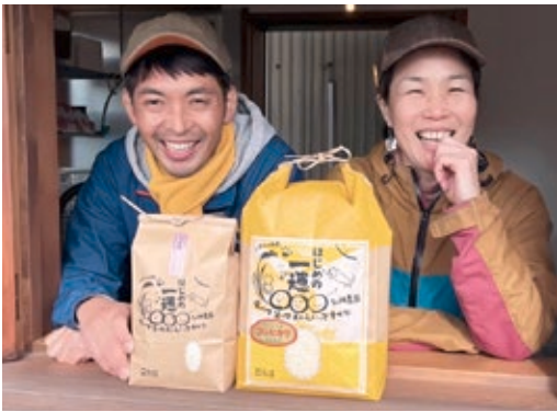
「出会いに感謝し、家族でイチゴと米を作っています」と話す多湖夫妻。