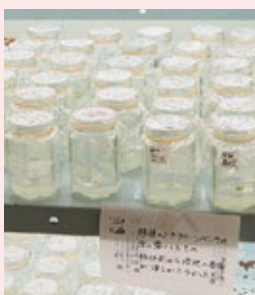
無菌室には培養中の小鱗茎が並ぶ。

ニンニクの鱗片(種球根)から根端を採取する竜也さん。(左) 耕作放棄地を含む1haでニンニクの栽培も手掛ける。