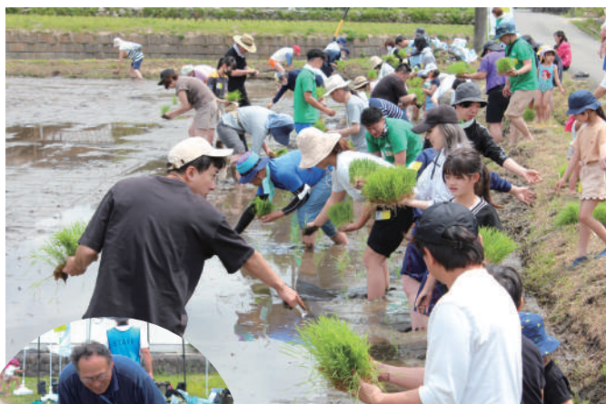
▲参加者全員で田植え開始

実際に農業を体験してもらうことで育てる楽しさを知ってもらうだけでなく、食の大切さを伝えていくために食育ソムリエの資格を取得しました。 今後は、小学校やJAなどと協力して米粉を使ったパンを作ったり食べたりして、お米のおいしさを伝えていく予定です。 「実際にいるんなことを体験し、食を通じてひとりでも多くの人が農業に興味を持ち、生産者になってくれたらうれしい」と笑顔で話しました。