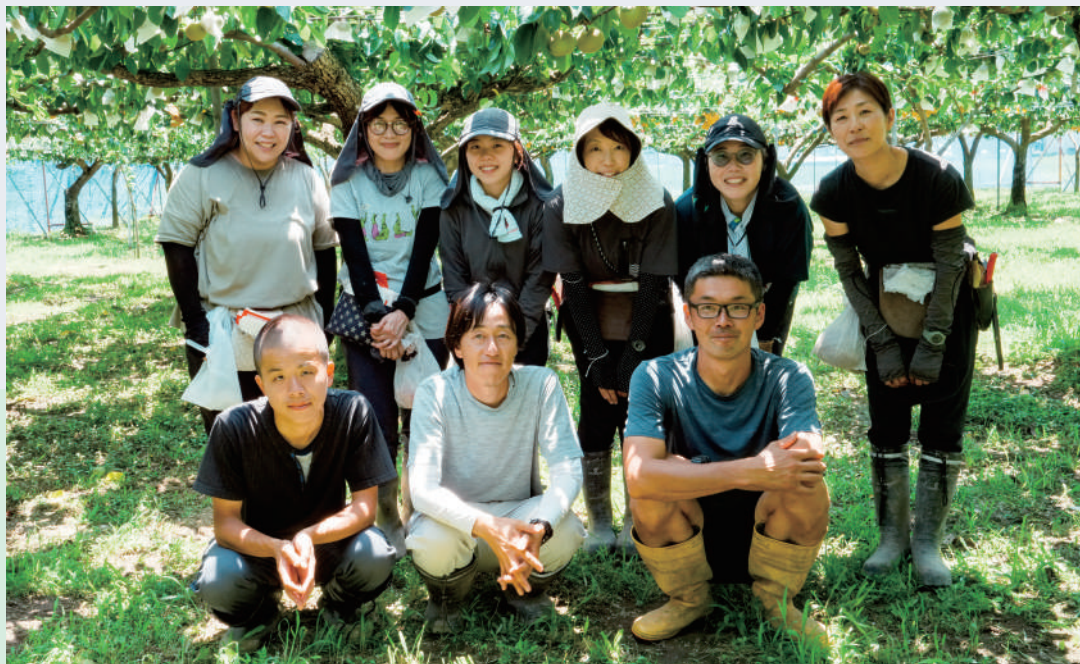
▲やまはぎ梨園の皆さん