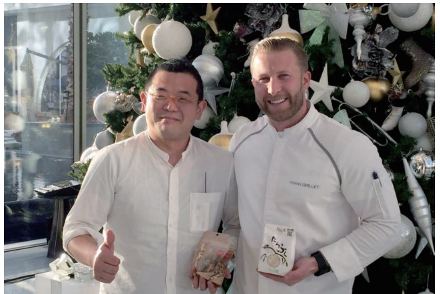
▲営業活動の場は海外にも。日本に居たら絶対に会えない人にもPRできるチャンス

●お問い合わせ先 所在地／津市大里陸合町1211 営業日時／平日9時～17時 ☎059(202)2205 ホームページ／ https://tarafuku.org/