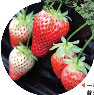
▲一粒を大きくするために栽培個数を調整している