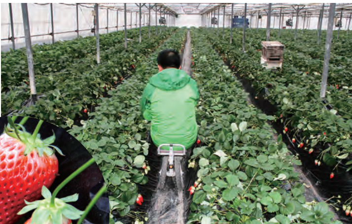
▲土の匂いやイチゴの芳醇な香りに包まれながらの作業は農業の醍醐味を味わえるという

土には地域の竹炭を混ぜ、土壌改善と同時に放置竹林問題の改良も目指しています。土耕栽培の難点である腰を曲げての収穫作業には、専用の台車を活用し、身体への負担を軽減しています。