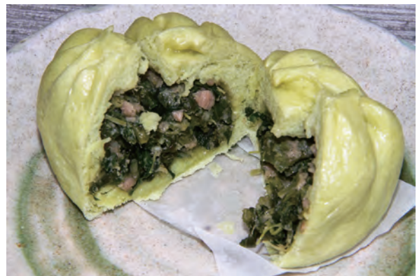
▲食べごたえもありながら、さっぱりとした味わいの「なばなまん」