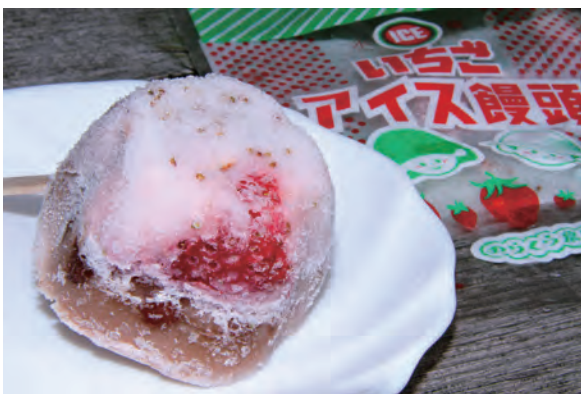
▲桑名市の老舗和菓子店と共同開発した氷菓「いちごアイス饅頭」