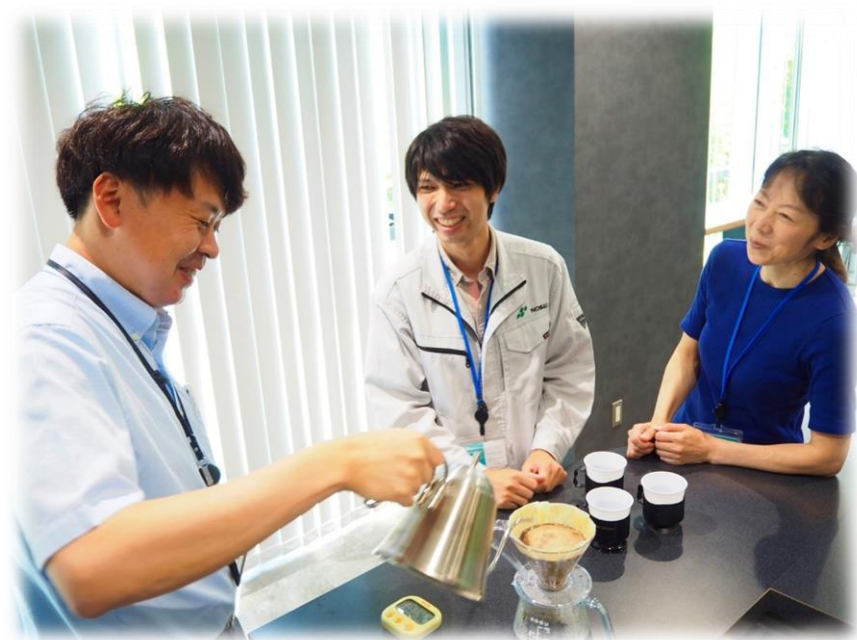
ランチタイムは、皆で淹れたてコーヒーを楽しんでいます。